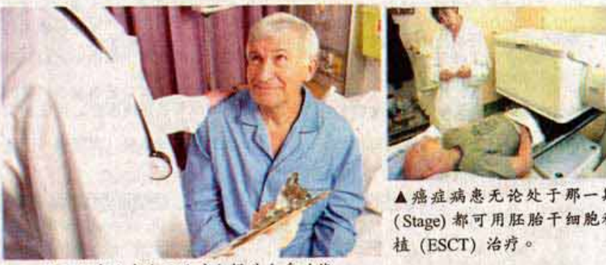
▲ 胚胎干细胞治疗除了治病也提升全身功能。